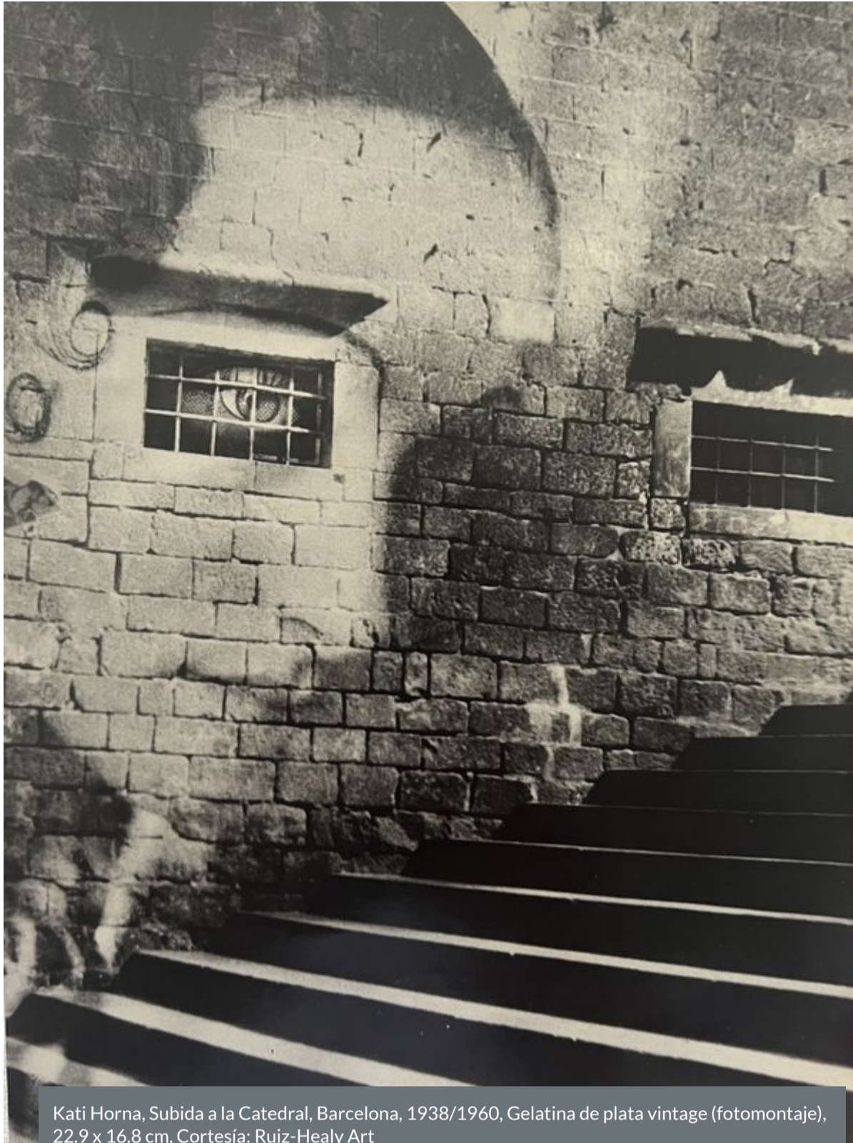
Kati Horna, Subida a la Catedral, Barcelona, 1938/1960, Gelatina de plata vintage (fotomontaje), 22.9 x 16.8 cm.

Mientras documentaba la Guerra Civil española de la mano de su amigo de la infancia Robert Capa , quien retrataba principalmente la primera línea, Horna registró las condiciones en las que vivían mujeres y niños en la guerra.