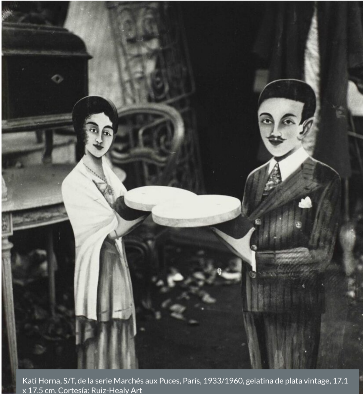
Kati Horna, S/T, de la serie Marchés aux Puces, París, 1933/1960, gelatina de plata vintage, 17.1 x 17.5 cm. Cortesía: Ruiz-Healy Art

Desde temprana edad, Horna se dedicó al activismo político de izquierda. Sus conexiones dentro del círculo político la llevaron a España, donde documentó la Guerra Civil española. Durante su estadía allí, fotografió los efectos de la guerra en las vidas de civiles, principalmente mujeres y niños.