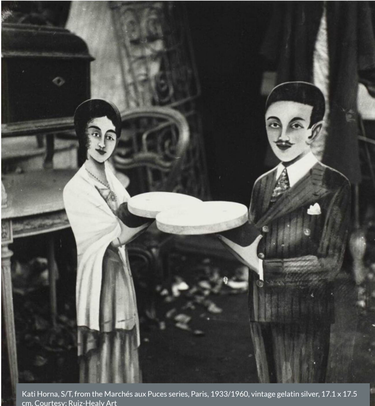
Kati Horna, S/T, from the Marchés aux Puces series, Paris, 1933/1960, vintage gelatin silver, 17.1 x 17.5 cm.

From an early age, Horna was engaged in left-wing political activism. Her connections within her political circle led her to Spain, where she documented the Spanish Civil War. During her stay there, she photographed the effects of the war on the lives of civilians, mainly women and children.