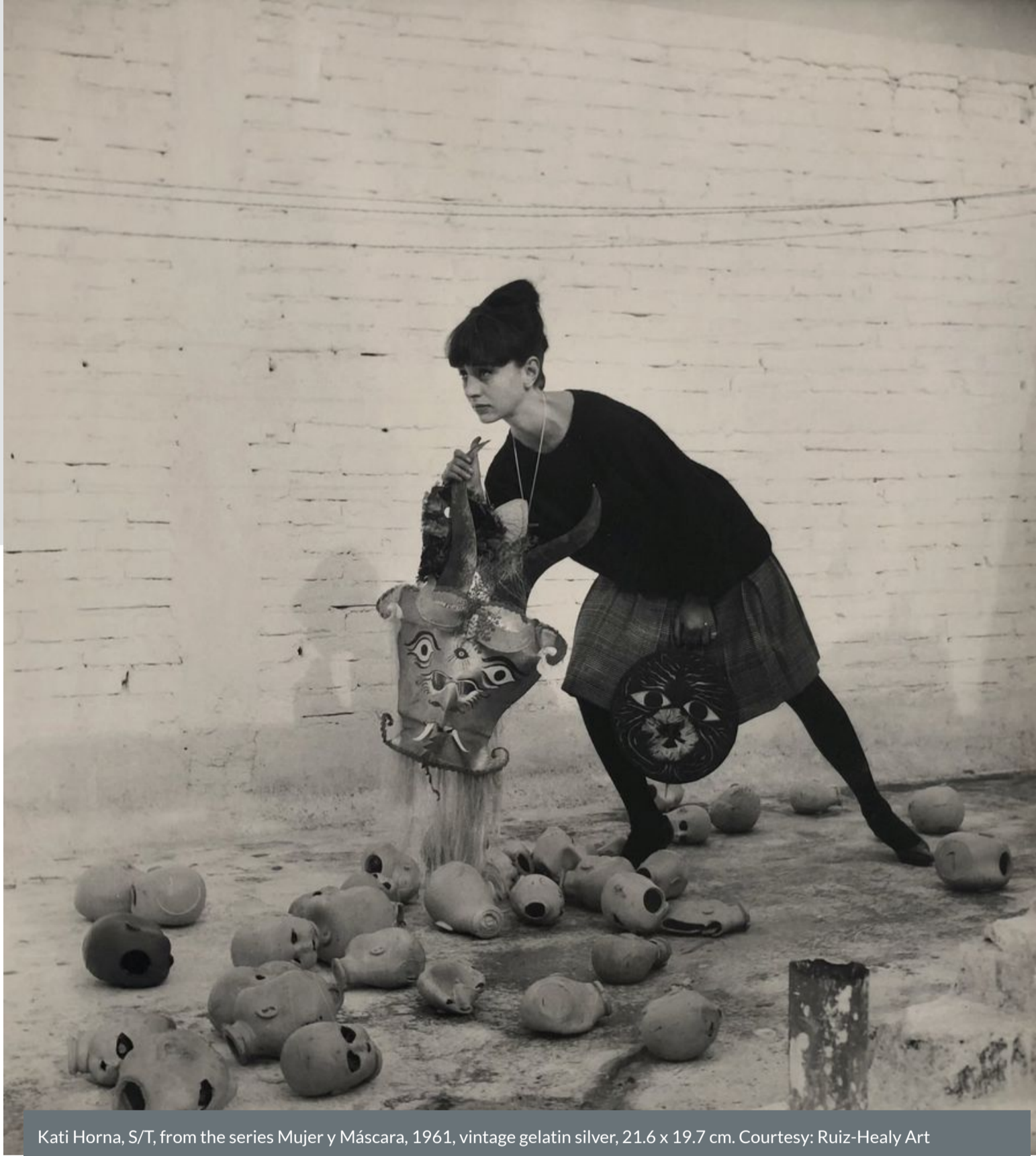
Kati Horna, S/T, from the series Mujer y Máscara, 1961, vintage gelatin silver, 21.6 x 19.7 cm. Courtesy: Ruiz-Healy Art