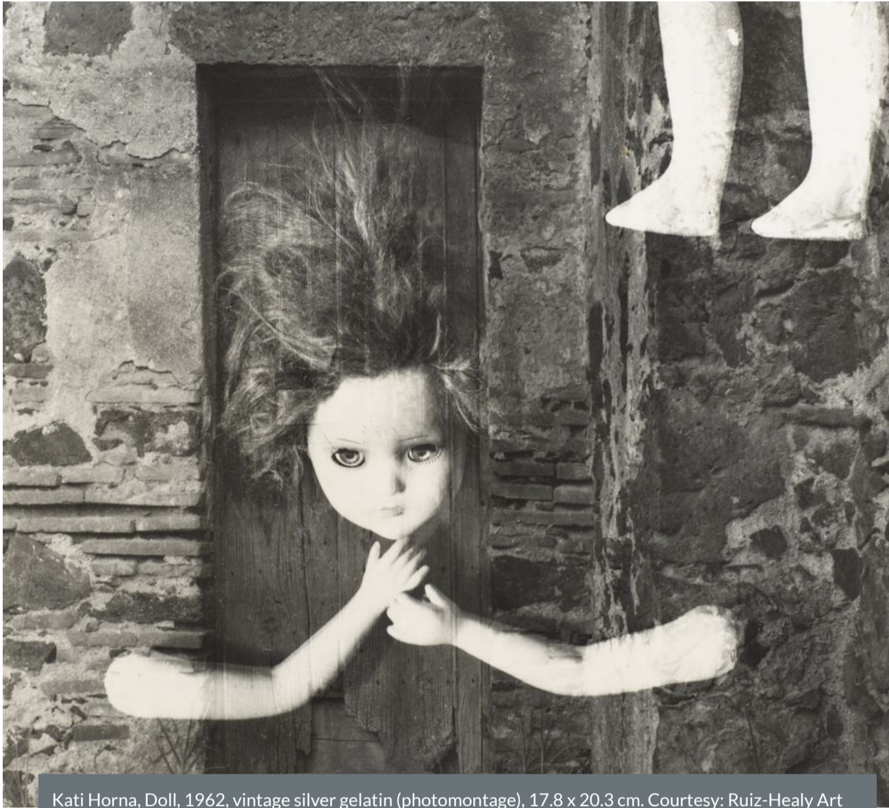
Kati Horna, Doll, 1962, vintage silver gelatin (photomontage), 17.8 x 20.3 cm.

The Muñecas, México series reveals the surreal images of broken or discarded dolls and mannequins, a keepsake Horna carried with her during the years she spent photographing the Spanish Civil War.