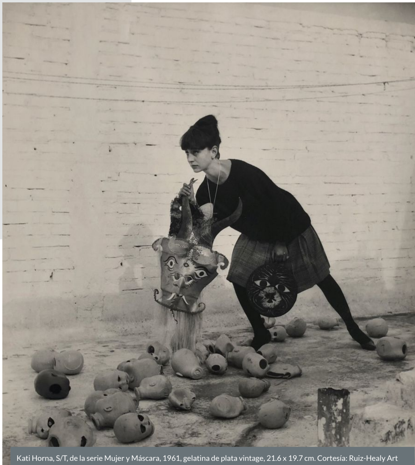
Kati Horna, S/T, de la serie Mujer y Máscara, 1961, gelatina de plata vintage, 21.6 x 19.7 cm.