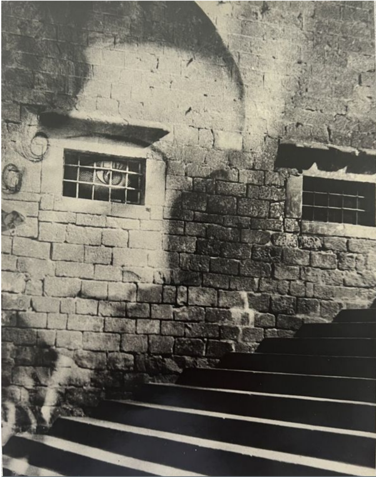
Kati Horna, Ascent to the Cathedral, Barcelona, 1938/1960, vintage gelatin silver (photomontage), 22.9 x 16.8 cm.

While documenting the Spanish Civil War with her childhood friend Robert Capa , who primarily portrayed the front lines, Horna recorded the conditions in which women and children lived in the war.