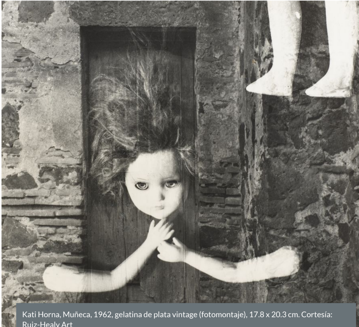
Kati Horna, Muñeca, 1962, gelatina de plata vintage (fotomontaje), 17.8 x 20.3 cm.

La serie Muñecas, México revela las imágenes surrealistas de muñecas y maniqués rotos o desechados, un recuerdo que Horna llevó con ella durante los años que dedicó a fotografiar la Guerra Civil española.