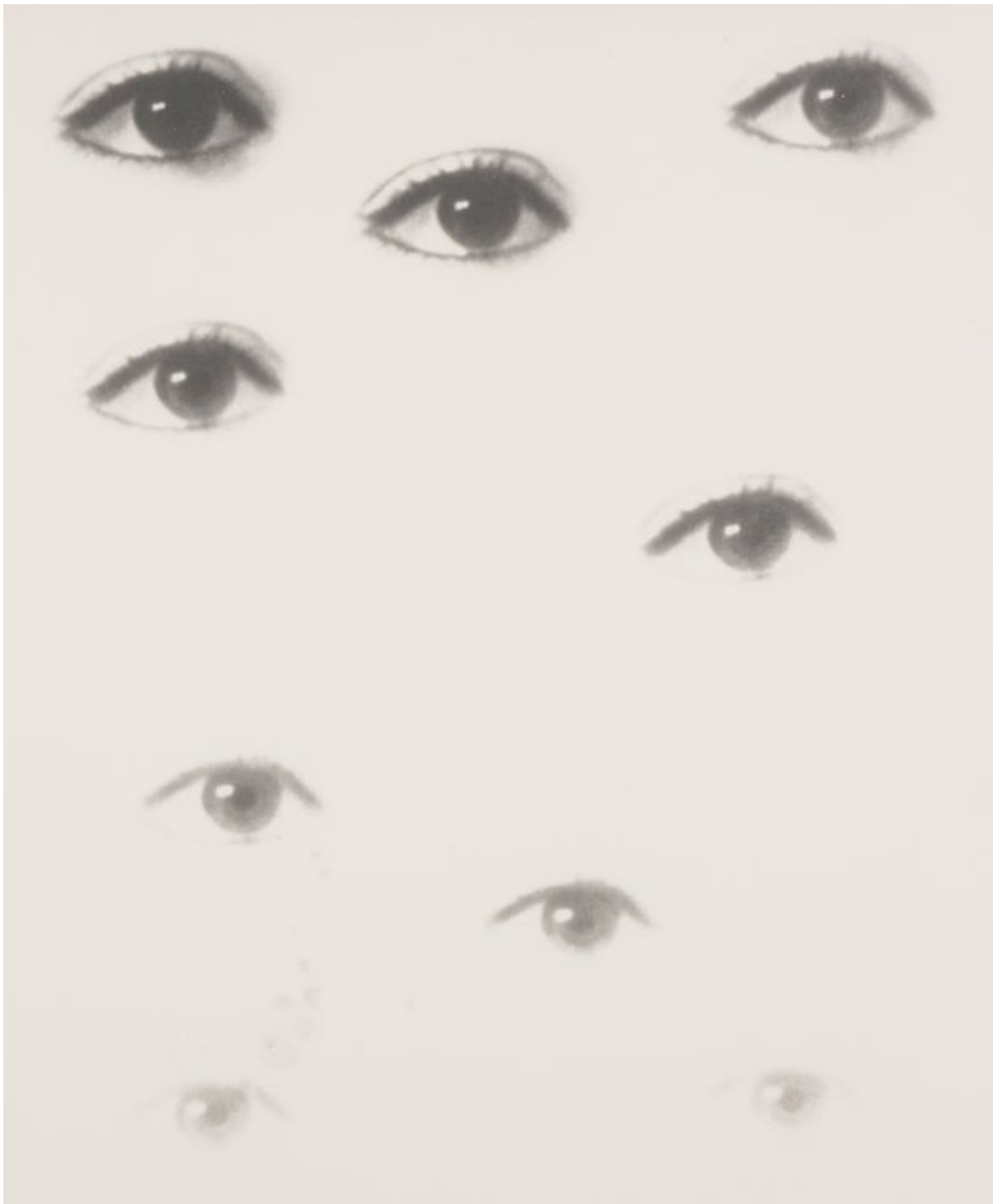
Kati Horna, S/T, Mexico, 1962, vintage gelatin silver (photomontage), 25 x 20.3 cm.

In the early 1930s, she left her home in Budapest, first for Berlin and then for Paris, where she honed her skills alongside other avant-garde artists of her generation.