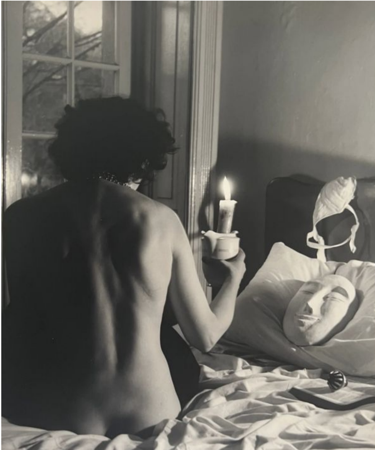
Kati Horna, Leonora, from the Ode to Necrophilia series, 1962, vintage gelatin silver, 25 x 20.3 cm.

In her series entitled Ode to Necrophilia (1962), Horna captures a woman grieving the loss of a loved one. Personally, this was a difficult time for her, as a result of the serious illness suffered by her husband, José Horna .