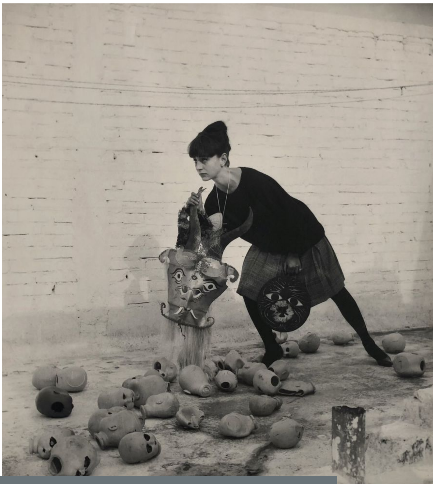
Kati Horna, S/T, de la serie Mujer y Máscara, 1961, gelatina de plata vintage, 21.6 x 19.7 cm.